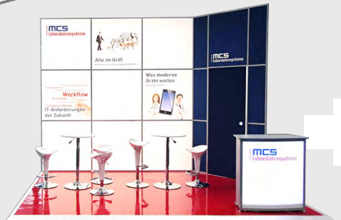
Fläche: 12 m 2