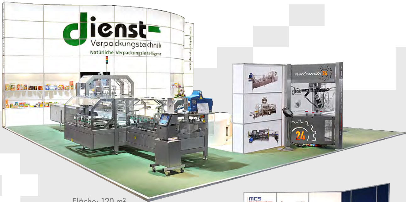
Fläche: 120 m 2