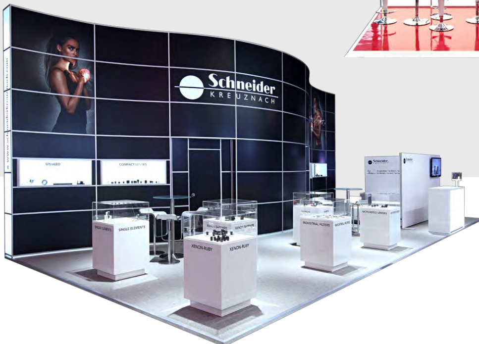
Fläche: 72 m 2