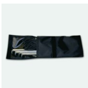
Heringe und Spannseile